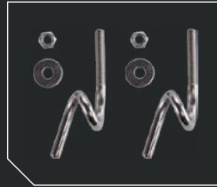
Комплект крепления на трос с витым крюком