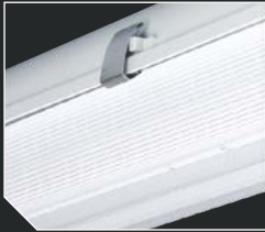
Зашелка из нержавеющей стали (под заказ)