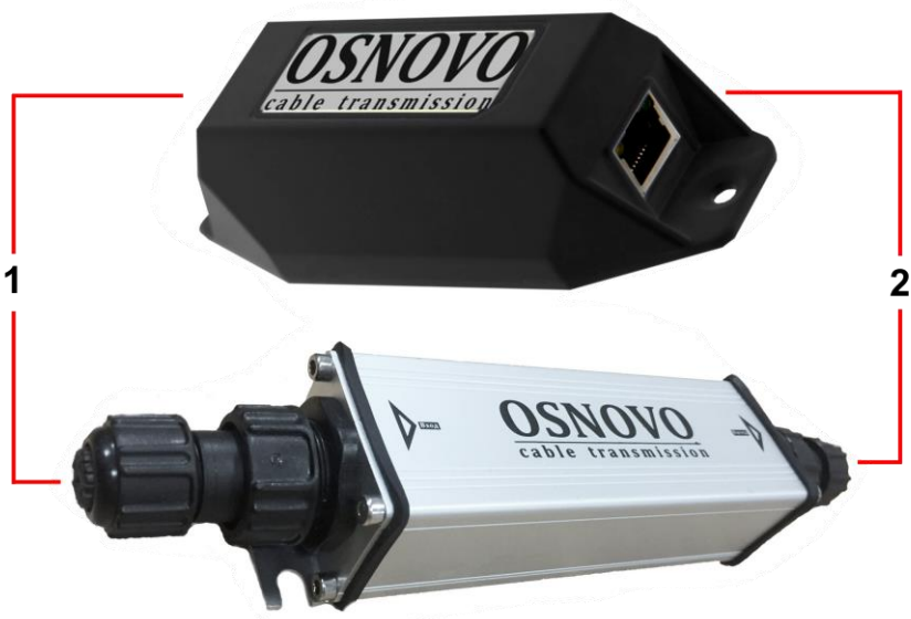
Рис.3 Удлинители E-PoE/1W, E-PoE/1GW, внешний вид