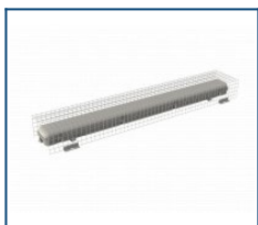
Защитная решетка LPO/LSP (1270*205*120)