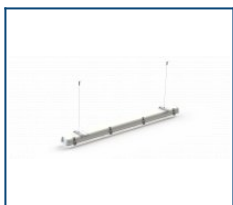
Тросовый подвес для LPO/LSP (комплект, 1 м)