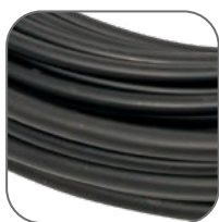
Оболочка из фторопласта

Секции нагревательные резистивные Ice Dam Free EKF PROxima (далее секции) применяются для обогрева объектов в различных областях хозяйства: при обогреве крыш, водостоков, открытых площадок, лестниц, пандусов от промерзания. В пищевой промышленности для разогрева или поддержания заданной температуры пищевых ингредиентов.