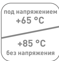
Максимальная допустимая температура