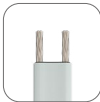
Материал токопроводящих жил – никелированная медь. Матрица не отслаивается от жил