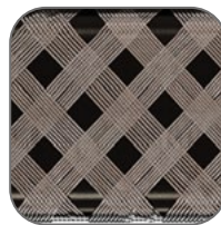
Сечение экрана составляет не менее 1 мм 2 , плотность не менее 60 %