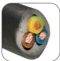
Материал токопроводящих жил – никелированная медь.