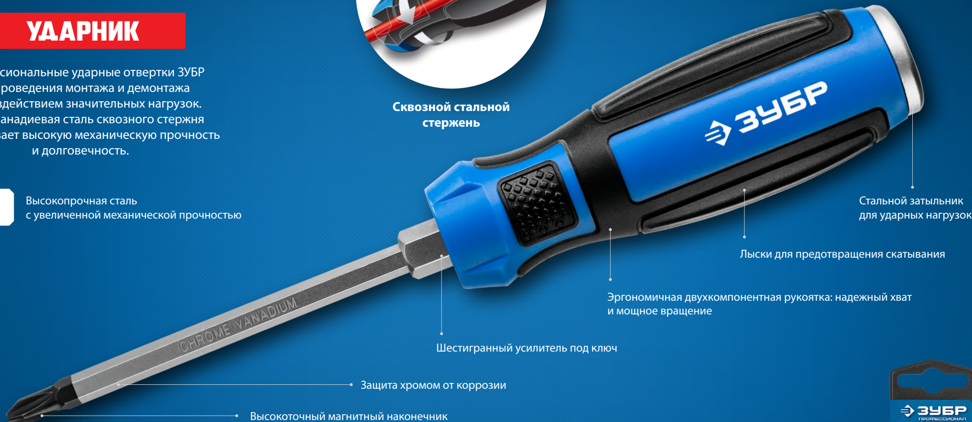
Стальной затыльник для ударных нагрузок